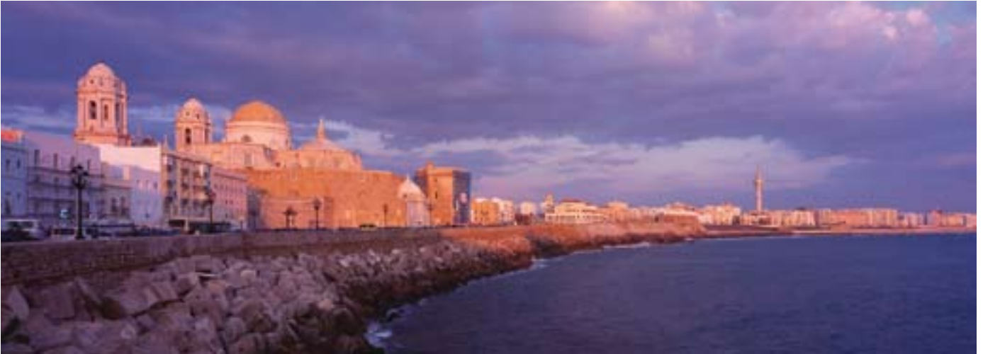
Panoramaansicht von Cadiz, der Hauptstadt der südlichsten Provinz Spaniens.

Andalusien ist die südlichste der 17 autonomen Gemeinschaften im Königreich Spanien und gleichzeitig die südlichste Region Europas, die Stadt Tarifa liegt nur 14 km von Marokko auf dem afrikanischen Kontinent entfernt. Die zweitgrösste spanische Comunidad Autónoma umfasst mit 87.268 km 2 mehr als 17 Prozent der Landesfläche Spaniens und ist damit mehr als doppelt so gross wie die Schweiz, jedoch leben in Andalusien nur 7,6 Millionen Einwohner. Zwar gehört Andalusien zu der mit durchschnittlich 87 Einwohnern pro km 2 am dichtesten besiedelten Region des Landes, allerdings findet man neben den pulsierenden acht Provinzhauptstädten wie Sevilla mit einer Population von rund 700.000, Málaga mit etwa 600.000 Einwohnern, Cádiz, Granada, Córdoba, Jaén, Huelva und Almería sowie den Lebenszentren entlang dem Fluss Guadalquivir und der 830 km langen Küstenlinie, an der rund ein Drittel der Andalusier lebt, vor allem im Landesinneren nahezu unbewohnte Landstriche. In mancher Provinz spielt sich das beschauliche Leben in den verwinkelten Gassen der kleinen Dörfer und auf den zum Flanieren einladenden Ramblas ab.