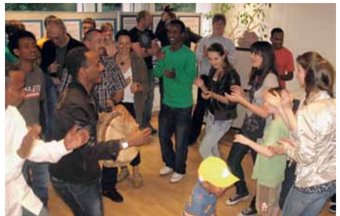
Begegnungsabend im Treffpunkt.

Als die Gruppe sich anfangs dieses Schuljahres überlegte, was sie im Sinne des «Break The-Silence»-Geistes tun will, war es schnell klar, dass der Einsatz für die Flüchtlinge weiterhin ein Hauptthema sein wird. Viele Menschen in diesem Land sind noch unzureichend über die Flüchtlinge informiert, ihr Denken, Reden und Handeln ist geprägt von Vorurteilen und Feindbildern. Dazu kommt, dass die Entscheidungen