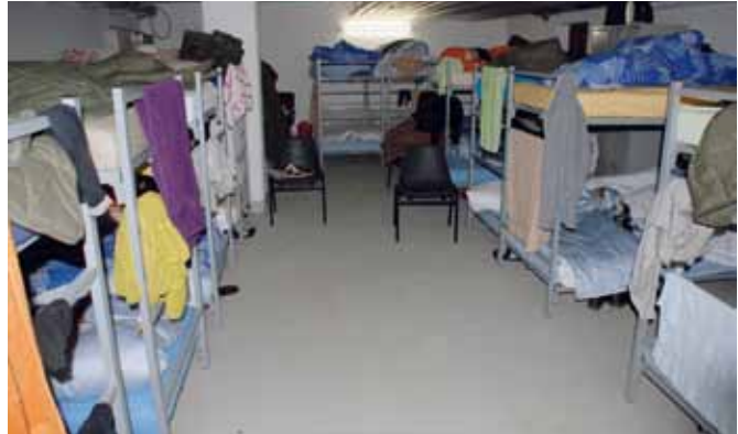
Unterkunft im Bunker des Gymnasiums.

Im vergangenen Jahr haben wir am Gymnasium versucht, Momente von Weihnachten zu ermöglichen. Momente, in denen Türen der Schule und Türen des Geistes geöffnet wurden, indem man sich informierte anstatt sich mit Vorurteilen zu betonierte, Momente, in denen Begegnungen und Kontakte stattfanden, die