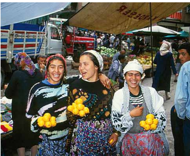
Zitronenverkäuferinnen auf dem Markt in Izmit, Türkei

Mehr Informationen auf www.rechtaufnahme.ch .