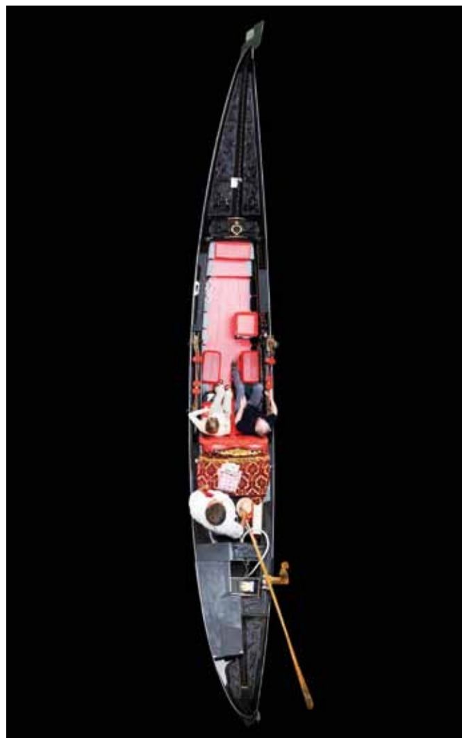
Dirk Brömmel, Gondola Nr. 15, Schwarz, 100 x 35 cm, 1/3, Diasec hinter Acryl, Mischtechnik, 2006

Die «fotografischen Arbeiten über Architektur» von dem Berliner Künstler Stefan Kiess haben seit Jahren nicht mehr bestimmte Bauten zum Thema. Schon in seiner ersten Einzelausstellung in der Galerie im Rahmen der ersten Triennale der Fotografie in Hamburg, in der er den Ausblick aus den 3m hohen Industriefenstern auf die City Hochhäuser 1:1 an der gegenüberliegenden Galerien-Wand nicht re-, sondern