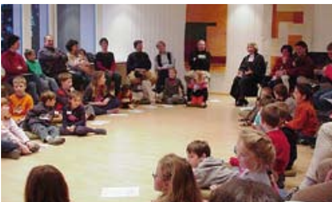
Gottesdienst zum Abschluss des Kinderbibeltages 2003

Dieser Missstand ist nicht nur menschlich enttäuschend, sondern auch theologisch fragwürdig. Denn für die Kirchen der Reformation ist und bleibt das gottesdienstliche Beten und Feiern – wie bekanntlich auch in den anderen christlichen Konfessionen – das eigentliche und unverwechselbare geistliche Zentrum des gemeinsamen Glaubens und Lebens. Mehr noch: «Gottesdienst im Alltag der Welt» (Römer 12, 1) ist keineswegs nur eine überholte biblische Reminiszenz, sondern das bleibende Signum von Kirche und Theologie, will sie den Menschen auch künftig noch etwas von Belang und Bedeutung zu sagen haben.