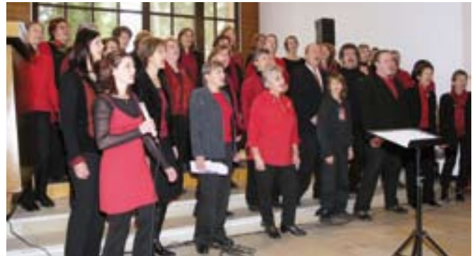
Unser Gospelchorprojekt seit 2006

Entgegen landläufiger Befürchtungen, dass Jugendliche eigentlich nur «Fun» und «Action» wollen, wenn man ihnen freie Bahn lässt, suchen sie im Gottesdienst bewusst einen Ort zur Begegnung mit Gott. Die höchste Quote der gesamten Umfrage – nämlich 80 Prozent – bezieht sich auf den Wunsch nach einer deutlich wahrnehmbaren Botschaft. Zum Ausdruck gebracht wird gerade die Sehnsucht nach einer vernehmbaren Zuwendung Gottes im Alltag, nach Zuspruch und Anspruch im Sinne dessen, was ich mir selbst nicht sagen kann.