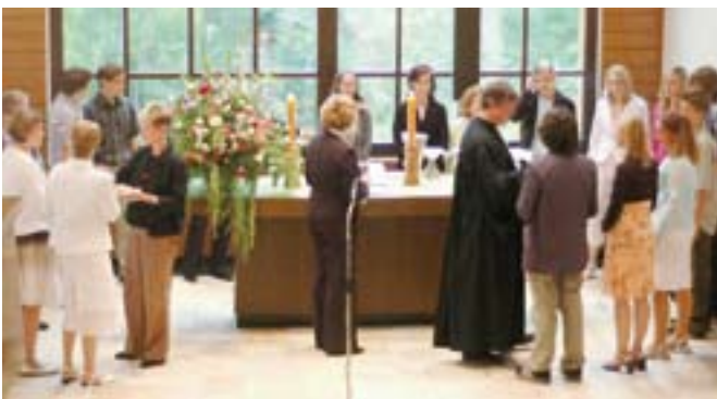
Abendmahl anlässlich der Konfirmation 2005

Geht man von unseren Alltagserfahrungen aus, so ist die Wahrnehmung von Kirche und Gottesdienst längst ins gesellschaftliche Abseits geraten. Darüber vermögen auch nicht unsere unterschiedlichen Bemühungen hinwegzutäuschen, den sonntäglichen Gottesdienst für die jeweiligen «Besucher» einladend und interessant zu gestalten – sei es durch zeitgemässe Jugendgottesdienste oder auch durch ansprechende Kasualfeiern.