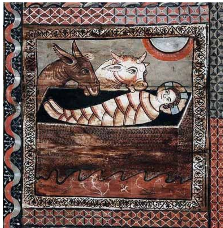
Ochs und Esel bei der Krippe. Ausschnitt von einer der 153 Tafeln auf der Romanischen Bilderdecke der Kirche in Zillis

Heute schimpfen wir einander blöde Kuh oder gemeiner Hund, nennen Verliebte einander Schmusekätzchen oder Turteltaube. Die Tiere sind nicht aus unserem Leben und Sprechen verschwunden. Aber reale Tiere sind den meisten von uns nicht mehr so