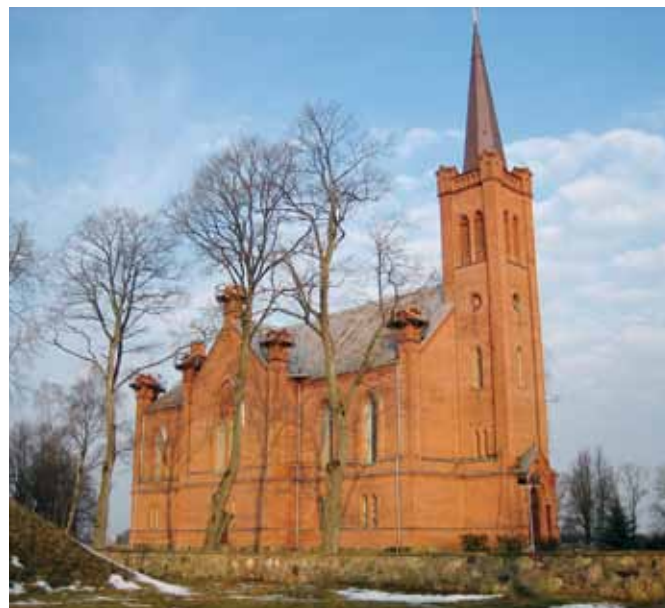
Die Evangelisch-Reformierte Kirche in Biržai

Das Zweite Helvetische Bekenntnis von Heinrich Bullinger aus dem Jahr 1562 war und ist neben dem Heidelberger Katechismus die Bekenntnisgrundlage der Evangelisch-Reformierten Kirche in Litauen. Dieses Bekenntnis ist aber weithin unbekannt, weil es bisher nicht in der eigenen litauischen Sprache gelesen werden konnte. Das wird sich nun ändern. Das Zweite Helvetische Bekenntnis ist zum ersten Mal in die litauische Sprache übersetzt worden und liegt im Dezember 2011 gedruckt vor. Auch in der Öffentlichkeit kann die Kirche nun deutlicher ihr reformiertes Selbstverständnis als christliche Kirche zum Ausdruck bringen.